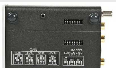
Phono Box S Schalter am Geräteboden >