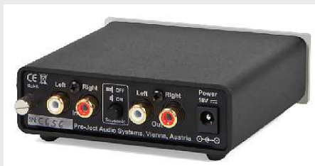
< Rückansicht Phono Box S

Die Phono Box S bietet natürliche Dynamik und Transparenz, analoge Wärme mit hoher Detailtreue sowie ein Höchstmaß an Klangreinheit bei allen Frequenzen. >>> Ein audiophiles Schnäppchen! <<<