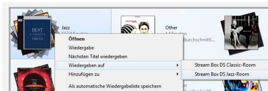
Oben: Screenshot 1